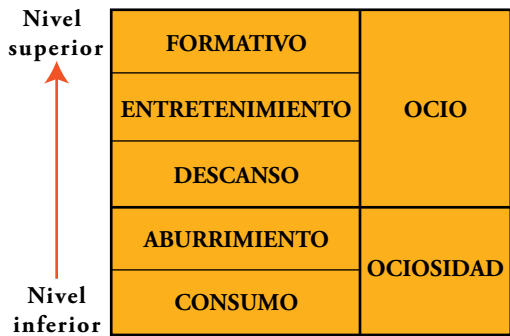
Niveles de tiempo libre

Quizás lo más interesante de la aportación de estos autores sean algunas consideraciones acerca de cómo se emplea el tiempo libre, es decir sus aspectos cuantitativos y cualitativos.